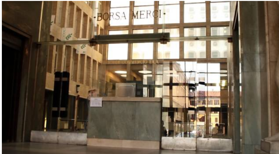
La Borsa di Vercelli

I mercati si rianimano ma è presto per cogliere le nuove tendenze